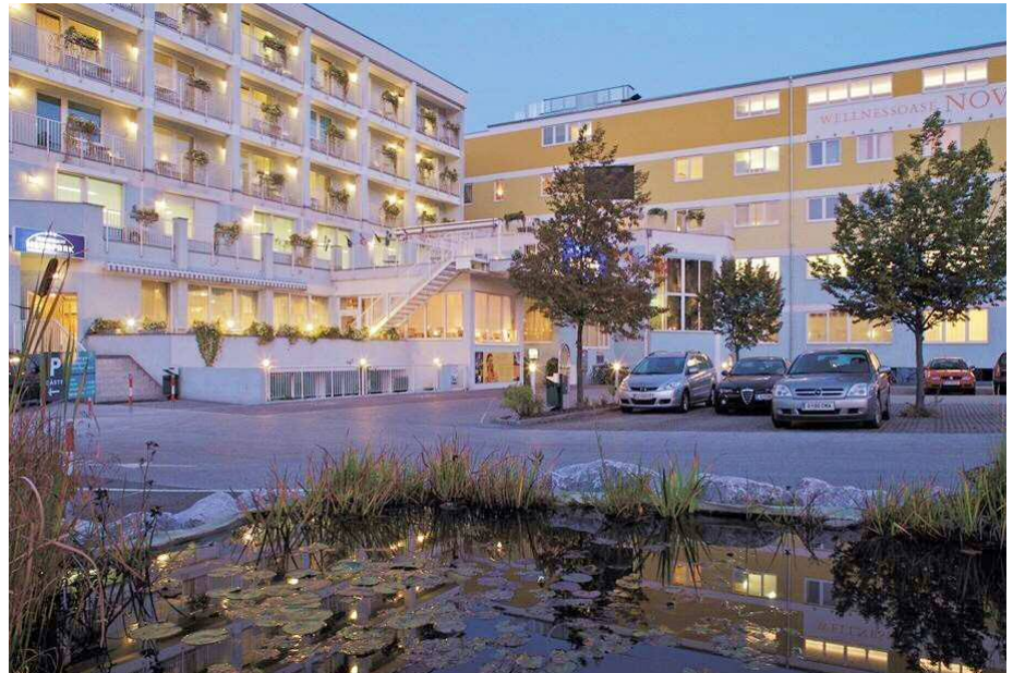
Das Hotel Novapark: Bequem, grosszügig gestaltet, mit Teichen und Grünflächen und einer grossen Wellnessoase.

A9 Fahrtrichtung Graz - Abfahrt 175 Richtung Graz Nord/Zentrum - nach 3,6 km links abbiegen in die Exerzierplatzstrasse (vor Interspar), nach 350 m rechts abbiegen in die Fischeraustrasse.