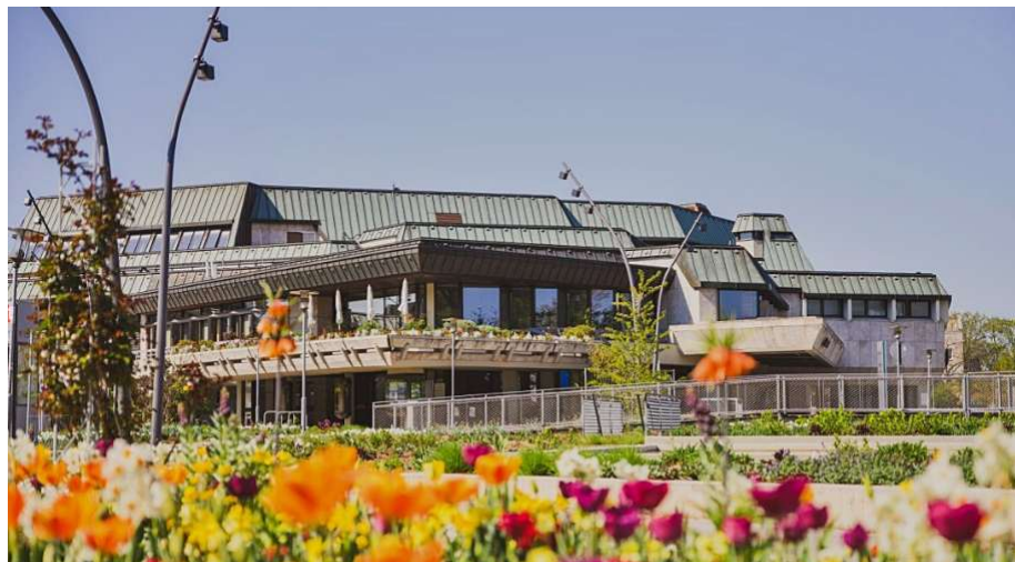
Die Schwabenlandhalle liegt in der Agglomeration der Stadt Stuttgart und weist die Vorteile der guten Anbindung an den ÖV und der schönen Lage im Grünen auf.